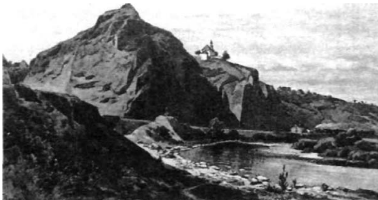
Tetínské skály počátkem 19. století, kdy ještě byly bez porostu. Tehdy v nich sídlil tajemný pták Kuhán