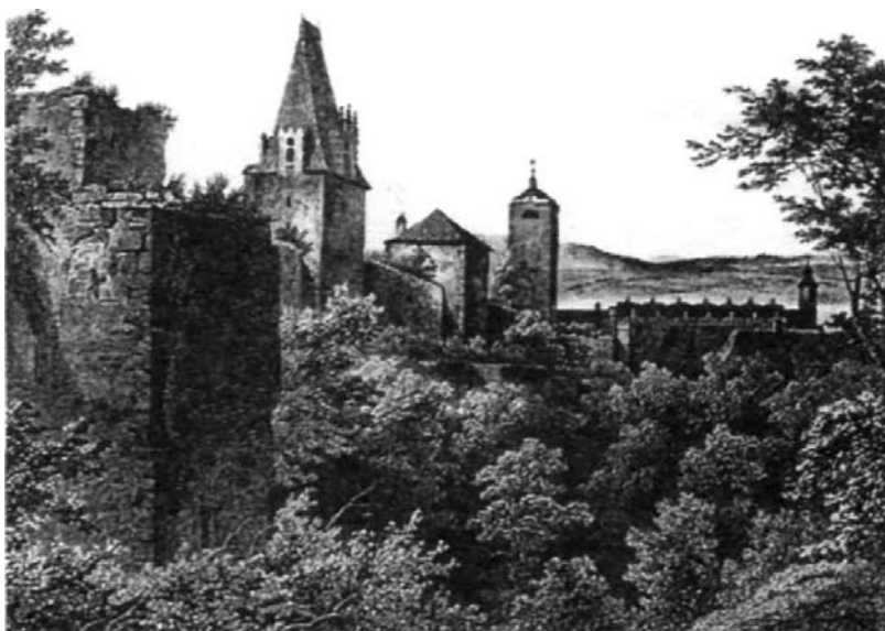
Hradby v Berouně, kresba ze třicátých let 19. století