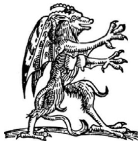
Démonický strážce „prokletého místa.“

Lidské emoce jsou tedy nepochybně spouštěcím mechanismem poltergeistů. Přesto musí být splněna ještě jedna podmínka - a tou je vhodné prostředí. Jiný anglický badatel v oblasti okultních jevů, Colin Wilson, když zkoumal případ „přízračného mnicha“, který řádil v jednom domku v městečku Yorkshire, došel k teorii, kterou nazval „systém najádového pole“ (podle najád, ochránkyně pramenů). U mnoha domů, kde údajně strašilo, doložil existenci trvale vlhkého podloží se silnými elektromagnetickými vlastnostmi. V těchto místech také mnohem častěji než jinde dochází k poruchám příjmu radiových vln a k selhávání elektronických přístrojů. Podle Wilsona funguje najádové pole jako velmi silný generátor energie, reagující neobvyklými fyzikálními jevy na různé provokující podněty.