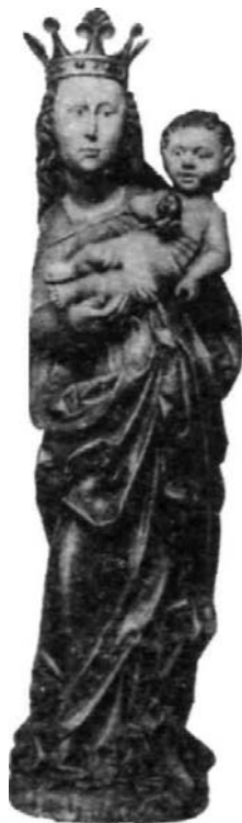
Dřevěná soška Svaté Dobrotivé po restaurování v roce 1993