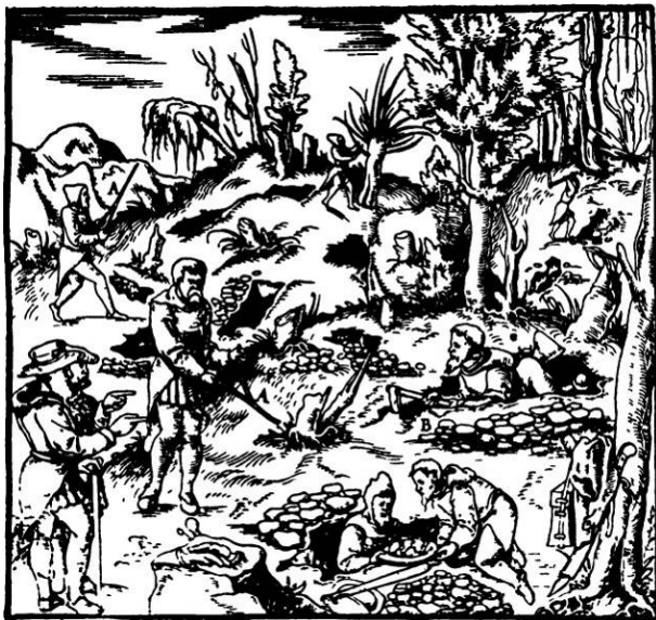
Dobývání rudy "v jámách" - nejstarší způsob těžby

A tak příběh o upálení horníků na Mořině nemusí být jen hrůznou povídkou, ale něčím, co má ke skutečnosti blíž, než si vůbec troupíme připustit.