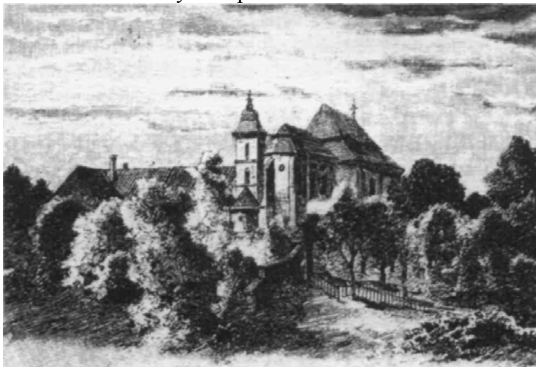
Klášter Sv. Dobrotivé

Ozdobná skříňka s ostatky „sv. Benigny - Dobrotivé“ byla vložena do otvoru na hrudi dřevěné sošky, která tu zřejmě už byla, ale které se od té chvíle začalo říkat Svatá Dobrotivá - stejně jako celému klášteru. Zpodobuje dívku v bílých šatech, s rozpuštěnými vlasy sepjatými čelenkou a s rukama zkříženými na břiše. V době baroka byla tahle stará řezba „vylepšena“ zlatou korunkou a do zkřížených rukou jí vložili palmovou ratolest mučedníků. Naštěstí restaurátoři v roce 1993 z ní nepatřičné dodatky odstranili a vrátili ji k původní čistotě. Prozatím je uložena v Plzni. Zůstává jedna znepokojujivá otázka: Není právě tato dívčí postava v bílém hábitu, pradávna ochránkyně rodu Buziců, nazývaná „Svatá Dobrotivá“, totožná s pannou Lídou a Bílou paní? Máme snad před sebou obraz prapůvodní bohyně, uctívané od nepaměti na tajemném lučním ostrově ve stínu brdských kopců?