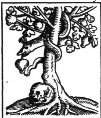
Had - symbol plodnosti

Kronikář poznamenává, že to bylo naposledy, co se lidé v Úpořském údolí s „hvízdajícím hadem“ setkali. Od těch dob už ho tam nikdo neviděl ani neslyšel.